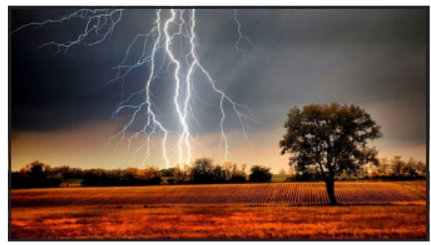
आजमगढ़। जिले के तीन